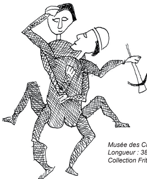
Musée des Cultures, Bâle Inv. Vb.2195. Longueur : 38 cm – Diamètre : 7 cm Collection Fritz Sarasin, collecté à Oubatche

Dans les vitrines sont présentés plusieurs bambous gravés de la collection de La Rochelle ainsi que des massues autrefois utilisées dans la cérémonie du pilou . Des ouvrages historiques et un carnet de dessins de Roger Boulay complètent ce dispositif.