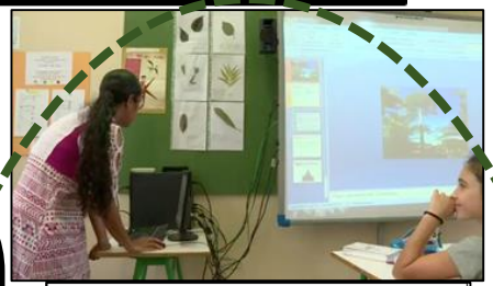
© NC1ère (CM) • 28 août 2018